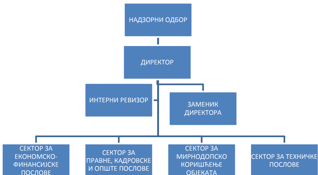
Дијаграм 1. Организациона структура ЈП за склоништа

У оквиру Сектора за техничке послове организоване су пословнице: Пословница у Новом Саду, Нишу и Крагујевцу, док је у Ужицу формирано одељење. По територијалном принципу пословнице обављају послове одржавања, издавања склоништа и пословног простора.